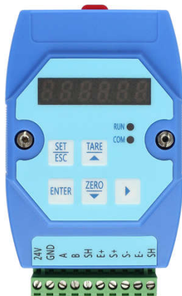
图 2-1 WTM201-C 正面图

显示界面为一排数码管，共六位数字，用于显示称重数据、仪表参数及提示信息等，图 2-1 为 WTM201-C 正面图。